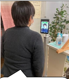
非接触型サーモカメラ

カメラに近づくと、自動で検温ができます。検温の後は手指の消毒も忘れずをお願いします。