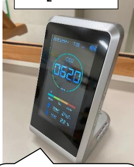
CO 2 メーター

事務スペース、スタジオ、研修室に設置します。数値が1,000ppmを目安に部屋の換気を行います。