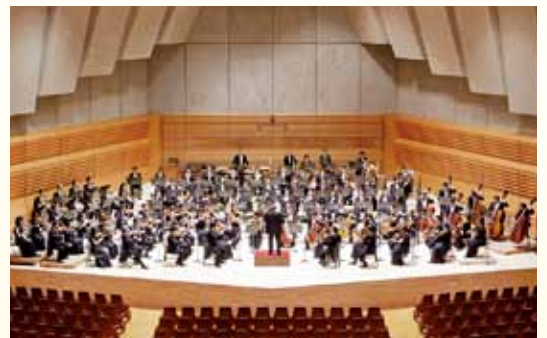
出演：松村 秀明(指揮) 仙台フィルハーモニー管弦楽団