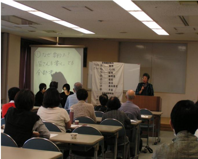
【OHPを使用した活動の様子】