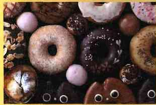
ハンドメイドドーナツ nijineco