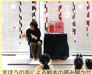
まほうの手による絵本の読み聞かせ