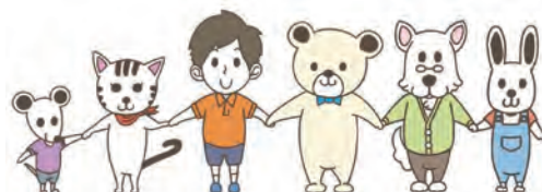
仙台市こころの健康づくり キャラクター『ここまる』