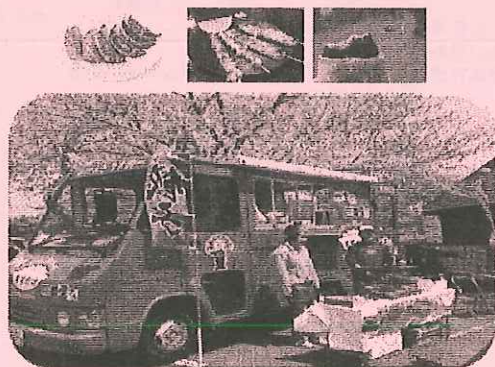
※ ずずかけの里・キッチンカー